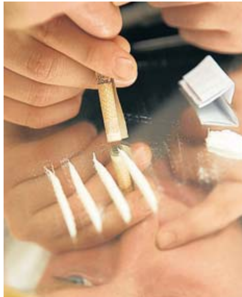
El 5% de les mostres de cocaïna contenien només cocaïna. En la resta, estava adulterada.

Una altra droga amb una alta taxa d'adulteració és l' speed , tot i que en aquest cas la tendència dels últims anys és lleugerament a la baixa. De les mostres recollides el 2011, poc més del 4% contenien només amfetamina. En la majoria, aquesta substància estava barrejada amb diluents i cafeïna. Tot i no