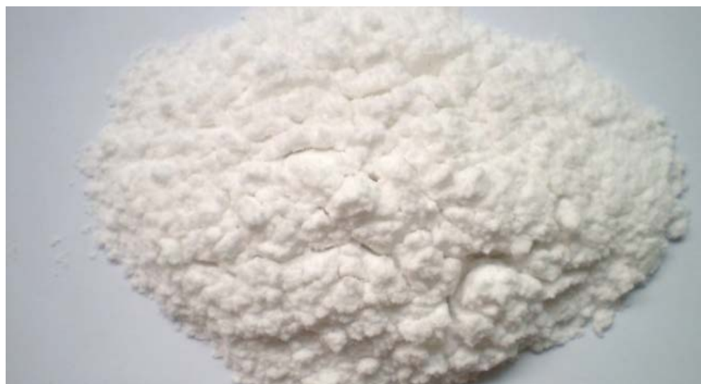
metoxetamina (MXE)

Me gusta 0 Tweet Compartir 0 Comentarios